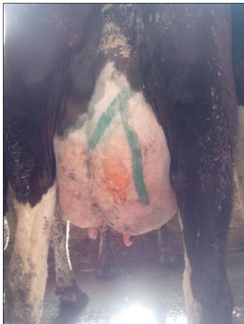
Abb. 1: Kuh Nr. 6173 VORHER