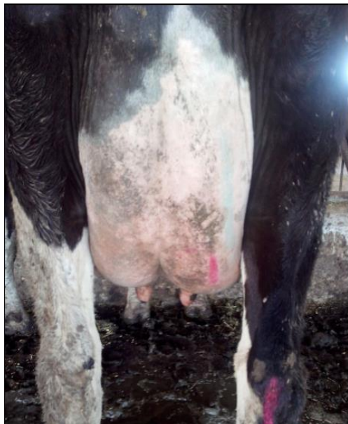
Abb. 3: Kuh Nr. 6173 Ergebnis der 1. Anwendung