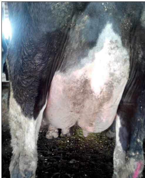
Abb. 4: Kuh Nr. 6173 Ergebnis der 2. Anwendung